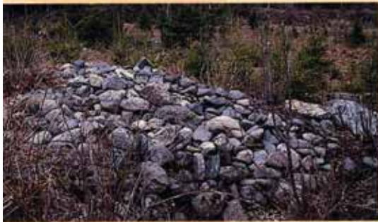
Gravrøys Holen gård

tredje tuften er 9 x 6 m. Rundt gården er det registrert ca 40 røysen og flere åkerterrasser nær husene. Røysene sydvest i området er sannsynligvis gravrøysen. Avstanden mellom røysene er så liten at det har vært vanskelig å dyrke jorden mellom dem. I 1988 ble det funnet et tykt kullag i den største av tuftene. Det betyr at huset har brent ned. Brannlaget er radiologisk datert til år 1165 - 1270 e. Kr. Sannsynligvis har gården eksistert flere hundre år før dette, altså i vikingtiden, år 800 - 1050 e. Kr.