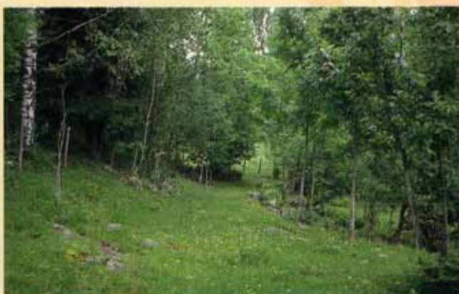
Middelalderveien Larshavna i Lomme- dalen

Leden er merket utenom Larshavna, langs Skollerudveien 500 m, og tar av Burudveien til høyre opp til Hellerudveien. Hellerudveien overleirer den gamle middelalderveien mellom Larshavna og Kirkeby. Middelalderveien går gjennom tunet på Hellerud gård, og videre gjennom det vakre bakkete landskapet ned mot Kirkebygårdene. Området er i dag golfbane. Hellerud gård er fra middelalderen. I et dokument fra 1336 kan vi