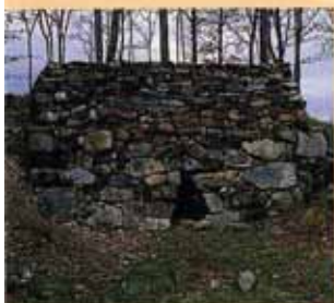
På Ringi gård er det en restaurert kalkovn.

Landskapet er meget rikt på kulturminner fra flere epoker. På Dalbo gård er det et stort helleristningsfelt fra bronsealderen og jernalderen. Det er 8 felt med motiver av skipsfigurer, kretstegn, fotsåler og skålgroper. Nordvest for Knabberud finnes det gravhauger og et kalksteinsbrudd.