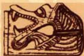
Detalj fra trerelieffet under.