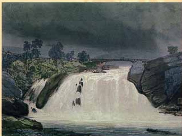
Cascade sur le Lysager, à Faabrôe, pres Christiania (Fossen ved Lysaker, Fåbro)

Leden går videre langs Vollsveien 200 m. Middelalderveien gikk lenger øst, i dagens villahager og har krysset skolegården på Jar skole. Den følger så i middelalderens veispor der Peder Ankers vei går i dag. Leden er merket til høyre i Skogveien, og tar til venstre ved Jarstien og Alfheimveien, videre frem