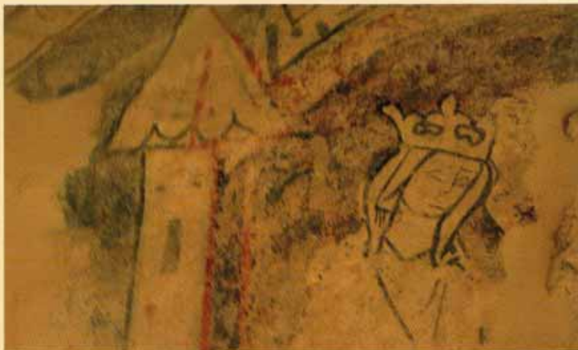
Kalkmaleri i Tanum kirke

Fleskum gård er den mest kjente av gårdene her, fordi eliten av Norges billedkunstnere, Erik Werenskiold, Christian Skredsvig, Eilif Petersen, Gerhard Munthe, Kitty Kielland og Harriet Backer tilbragte sommeren 1886 her. Stemningsmaleriet med nyromantikken slo ut i full blomst med berømte nasjonale verk som: «Gutten med seljefløyten» av Chr. Skredsvig, «Sommernatt» av Eilif Petersen og «Sommernatt» av Kitty Kielland, alle malt ved Dælivannet. «Fleskummalere» er blitt et begrep i norsk kunsthistorie.